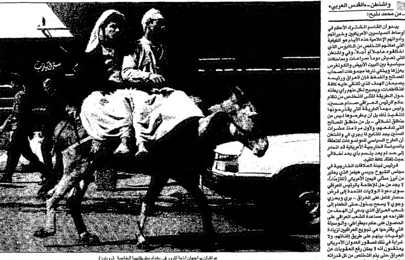
عراقان يهاجمان أزمة اللوبي في بغداد بفرطهما الخاصة

للام المتحدة في بيانها الصادر في 17 كانون الثاني (يناير) 1998، حيث أعلنت عن قرارها بزيادة العقوبات الاقتصادية على العراق، وذلك في إطار عملية عسكرية جديدة ضد صدام حسين. وقد تجرأت صدام حسين على تجاهل قرارات الأمم المتحدة، مما دفع إلى اتخاذ الإدارة الأمريكية خطوات إضافية لتفكيك أسلحة الدمار المتعمد العراقية. في هذا السياق، فإن اللوبي الصهيوني في واشنطن، الذي يعتبر صدام حسين مسؤولاً عن عواقب بقاءه في العراق، قد بدأ حملة إعلامية وسياسية مكثفة لتأجيل أو إلغاء العقوبات. وتأتي هذه الحملة في إطار جهود صدام حسين لتفكيك أسلحة الدمار المتعمد، والتي تعتبرها الإدارة الأمريكية تهديداً للأمن العالمي.